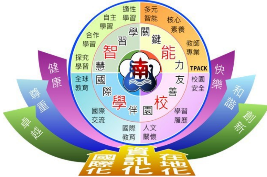
圖 1. 南港國小學校願景