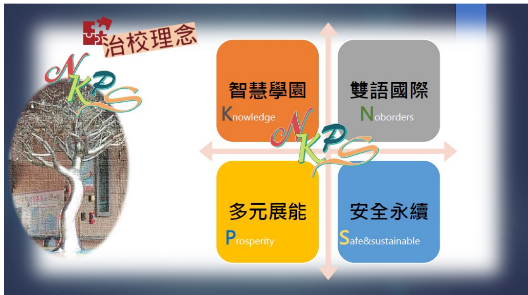
圖 2. 學校治學理念